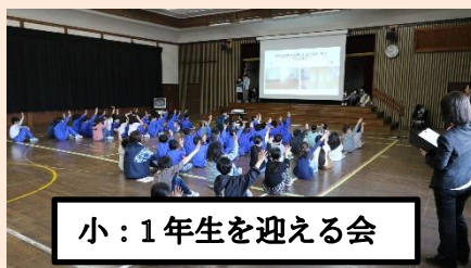
小：1年生を迎える会