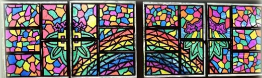
小中全校制作「ステンドグラス風アート」