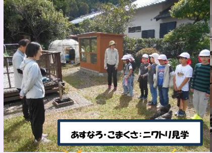
あすなろ・こまぐさ:ニワトリ見学