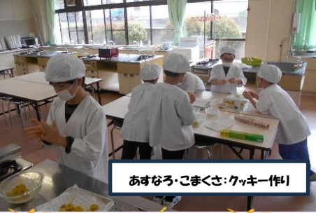
あすなろ・こまぐさ:クッキー作り