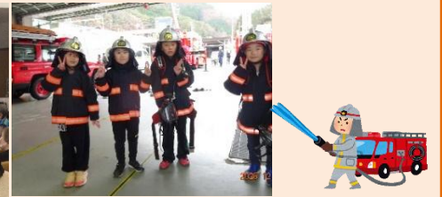
小6：木曾町中学校体験授業