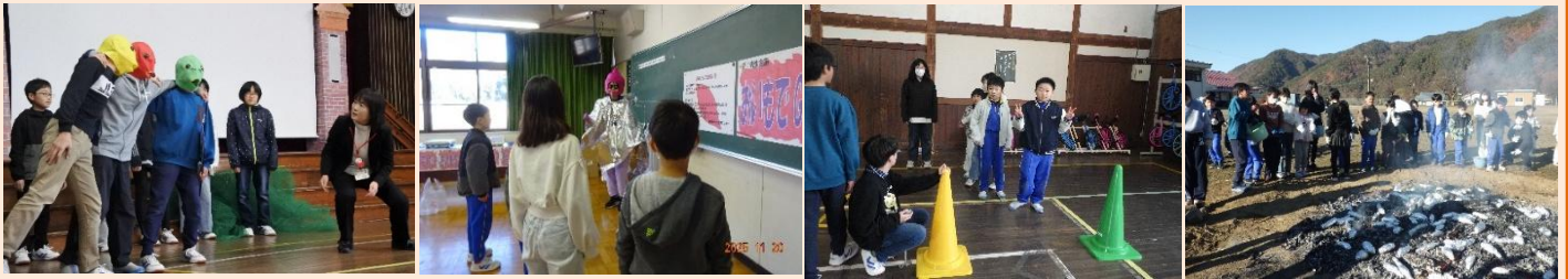
小1・2グレイスフル日義との交流

「思い出をたからものに！最高の児童大集会」をテーマに児童大集会が行われました。当日は、オープニングから盛り上がりました。代表園芸委員会、衛生委員会、放送委員会、図書委員会、そして先生方からも工夫された企画が行われました。1年生から6年生まで楽しみました。会の最後は、全校で育てたさつま芋を焼き芋にいただきました。笑顔がいっぱい、おなかもいっぱい。全校の笑顔のためにリーダーシップをとった6年生、頼もしい姿でした。この日の思い出は、子どもたちにとって、かけがえのない宝物になることでしょう。